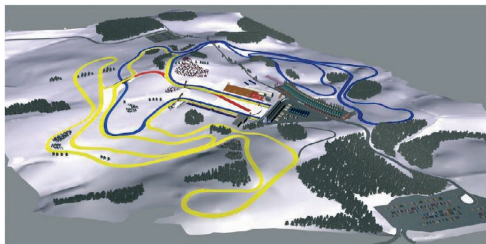
Vizualizace libereckých běžeckých tratí.