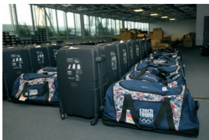
Pro olympioniky bylo vše perfektně připraveno.

Čeští reprezentanti začali hned po 21. lednu, kdy proběhlo nominační plénum ČOV, fasovat ve vysočanské aréně olympijskou kolekci Alpine Pro. Byli jsme u toho.