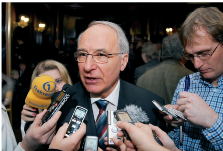
Předseda ČOV Milan Jirásek v obležení novinářů.

Na konto českého olympijského týmu padají před startem zimní olympiády ve Vancouveru superlativy. Forma českých hvězd je velká a experti i fanoušci doufají, že by se mohlo podařit překonat rekord šesti medailí z her v Sarajevu 1984. „Z formy našich sportovců mám velkou radost, ale zkušenost mi říká, že je lépe se držet při zemi,“ podotýká předseda Českého olympijského výboru Milan Jirásek.