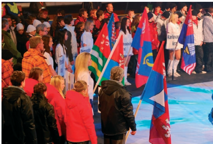
Nástup výprav z jednotlivých krajů při slavnostním zahájení.

Soutěží se v Liberci, České Lípě, Jablonci nad Nisou, Harrachově a Rejdicích, umělecké soutěže se konají v libereckém Centru Babylon. Velkými favority Her byli před jejich zahájením právě mladí liberečtí sportovci, kteří kralovali všem předchozím třem ročníkům. Zimní hry se