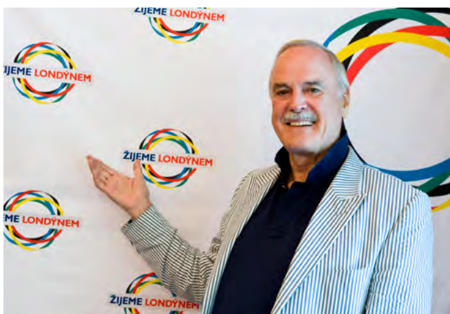
Cleese podpořil i kampaň Žijeme Londýnem.