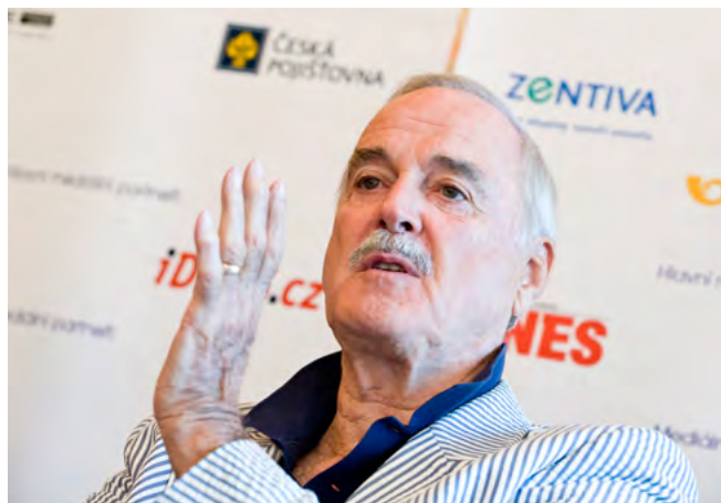
Na tiskové konferenci s českými novináři v pražském hotelu Intercontinental.