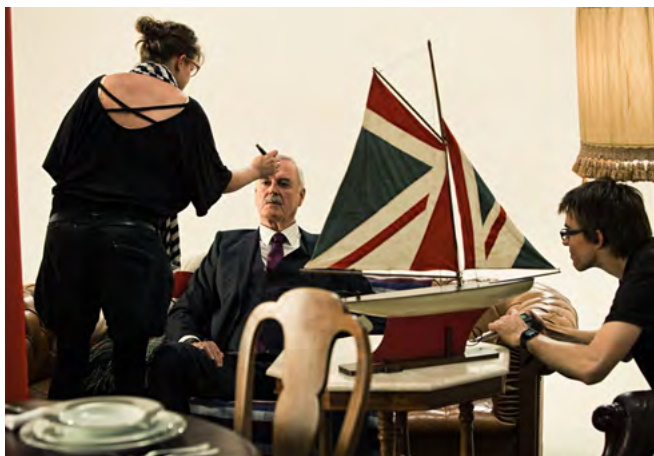
Nezbytný make-up před natáčením prvního spotu.