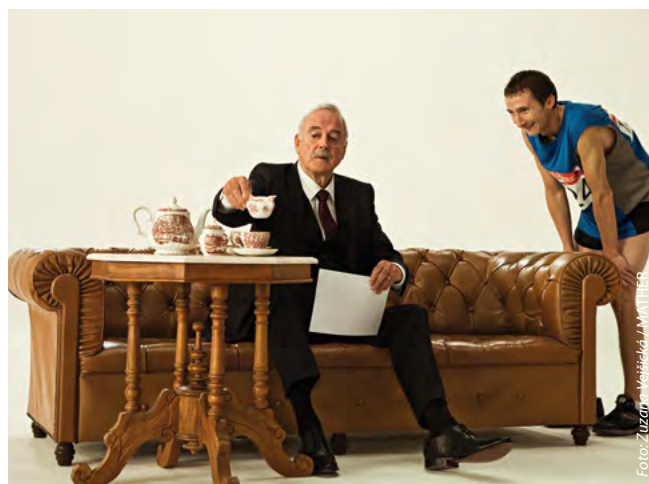
Fotoreportáž z natáčení najdete na stranách 12 a 13.