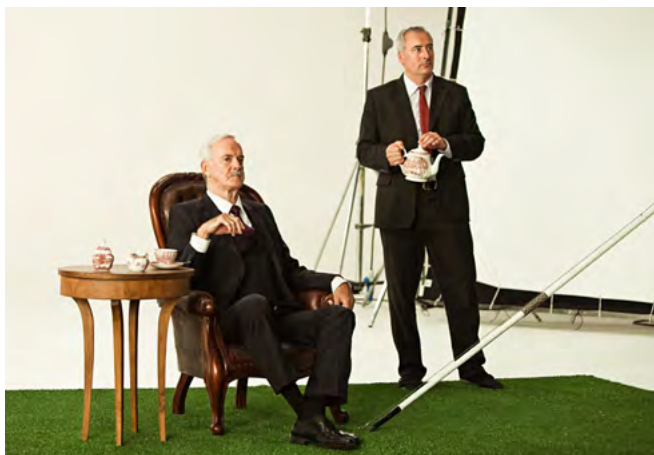
John Cleese společně s komparzistou. Při jednom ze spotů přiletne na scénu oštěp.