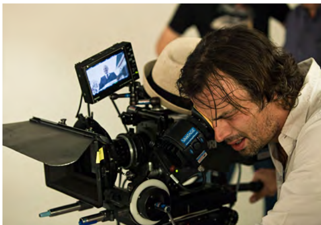
A jede se naostř!