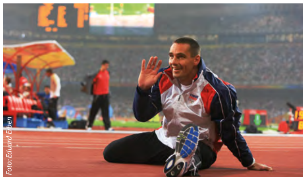
Desetibojář Roman Šebrle se představil v 18. dílu pořadu.

Velké sportovní výkony, české olympijské hvězdy, cesta do Londýna 2012, ale také pohled do světa fanoušků. Nejen to nabízí Olympijský magazín, společný projekt České televize a Českého olympijského výboru.