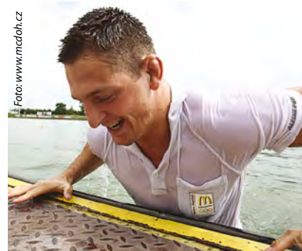
Judista Lukáš Krpálek