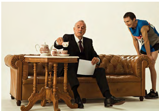
Spoty se věnují i britské klasice – čaji o páté